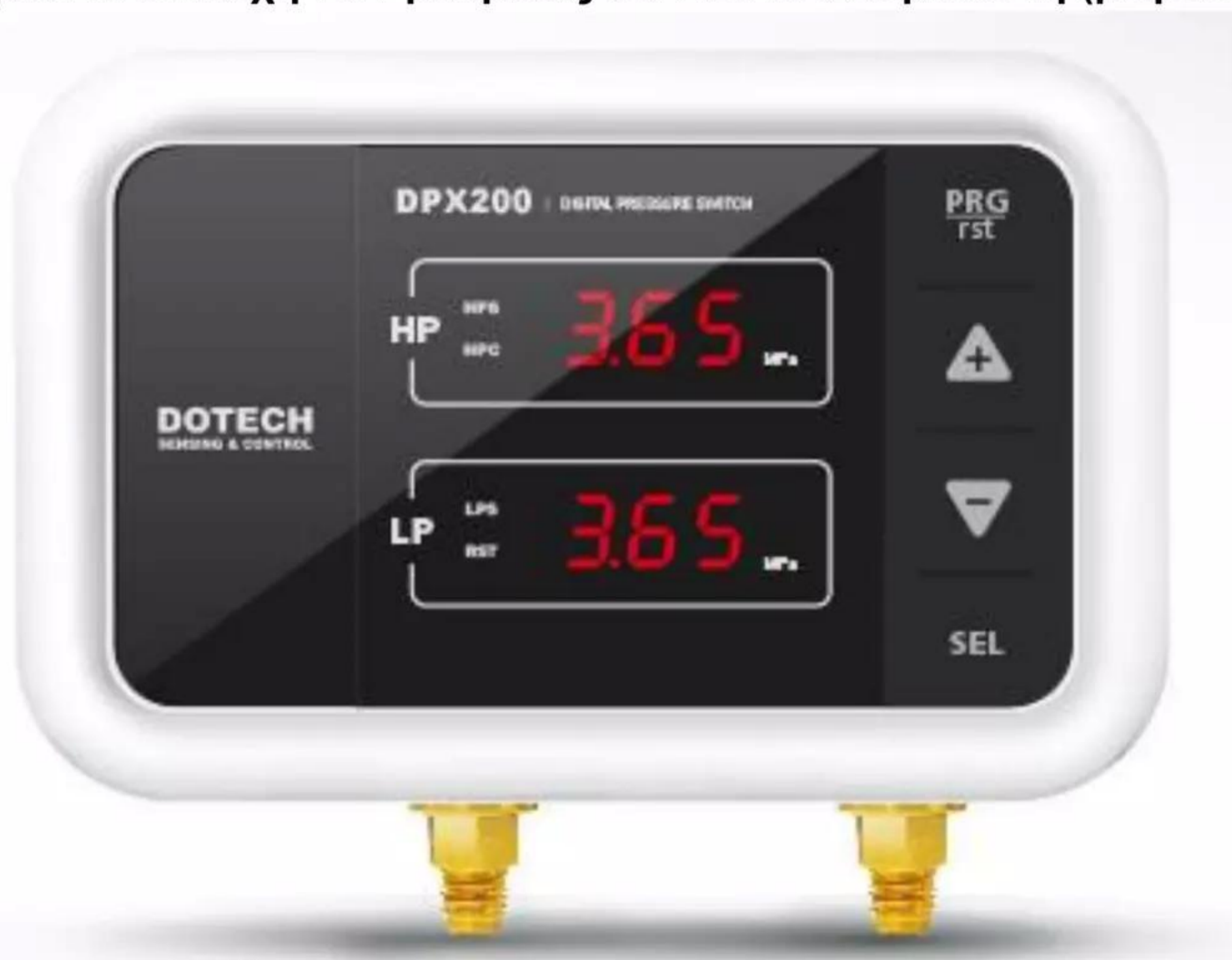
DPX200 Digital Pressure Multi Switch